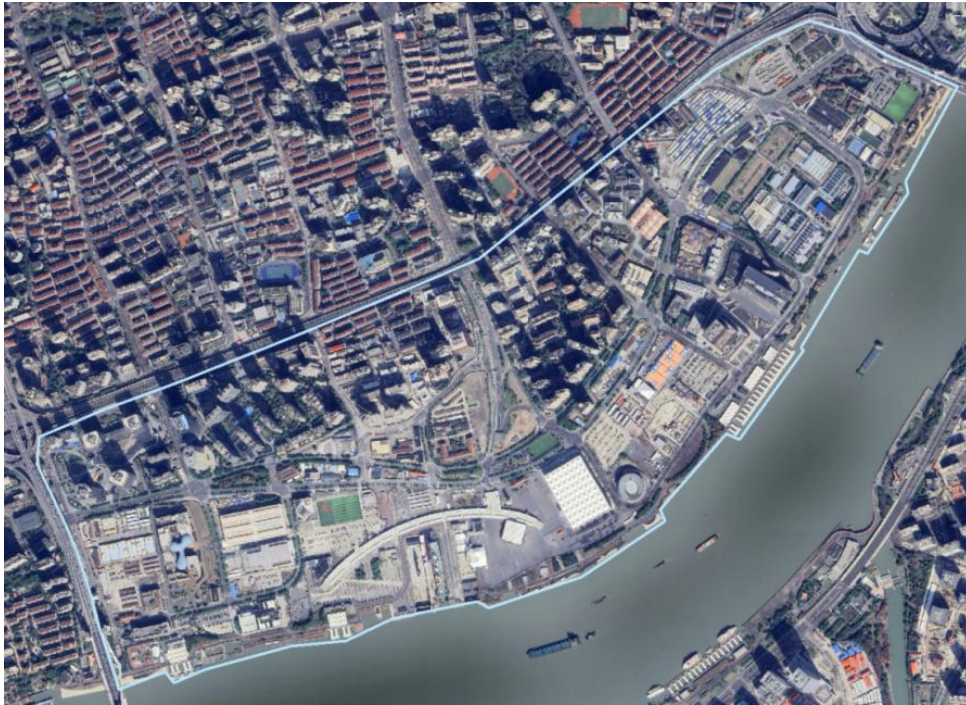
图 1 蒙自系统范围图