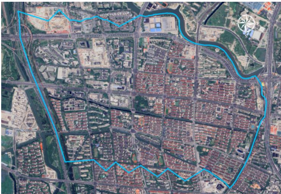
图 2 北新泾北排水系统范围图

北新泾北排水系统位于上海市长宁区，为分流制强排系统，通过北新泾北泵站将雨水径流排入吴淞江-苏州河。该系统服务范围 3.5km 2 。