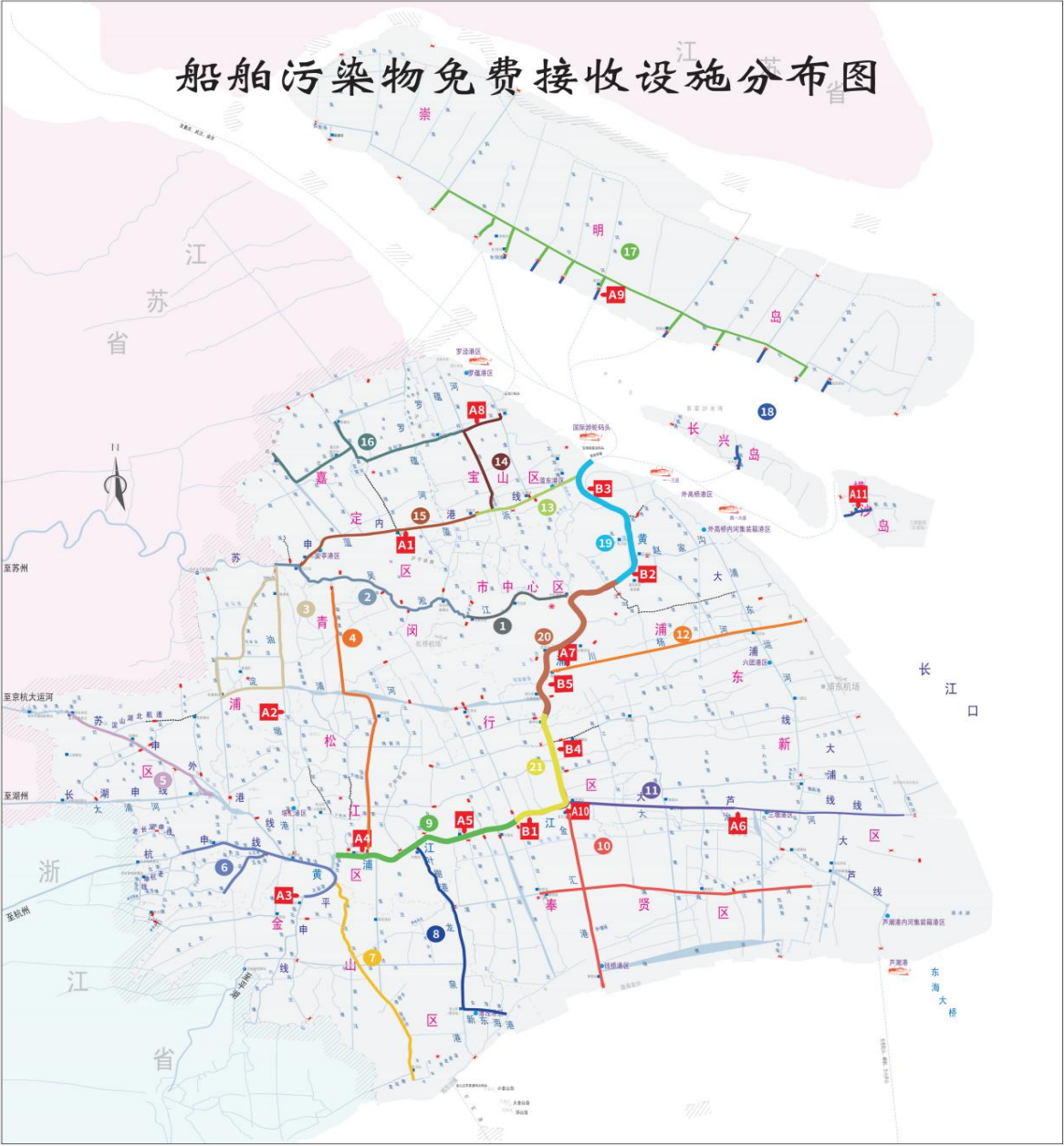
图 1：黄浦江及内河通航水域船舶污染物免费接收设施分布图

5、 具体方案： 本项目全年无休实施服务作业。整体作业方案为在本市境内共设置 21 条流动接收线路，安排不少于 25 艘流动作业船舶在黄浦江及内河通航水域巡回作业（线路明细见表 1）， 每艘船舶每日提供不少于 10 小时航行及接收作业服务； 同时配备不少于 6 艘大型转运船舶，及时将流动接收船和固定点接收的污染物转运至处置点， 每日提供不少于 10 小时航行及转运作业服务； 另在黄浦江下游段设置 5 个固定接收点（固定点分布见表 3），便于往来船舶自主选择、就近停靠交投污染物，提供 24 小时接收服务。