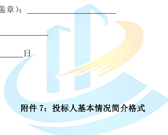
附件 7：投标人基本情况简介格式