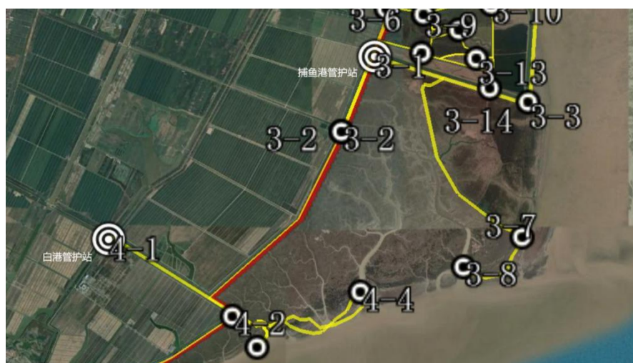
自然滩涂线路部分 点 3-8，点 4-4。