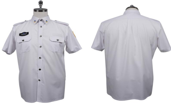
3) 女士短袖衬衣：白色、需在胸襟处加防走光扣