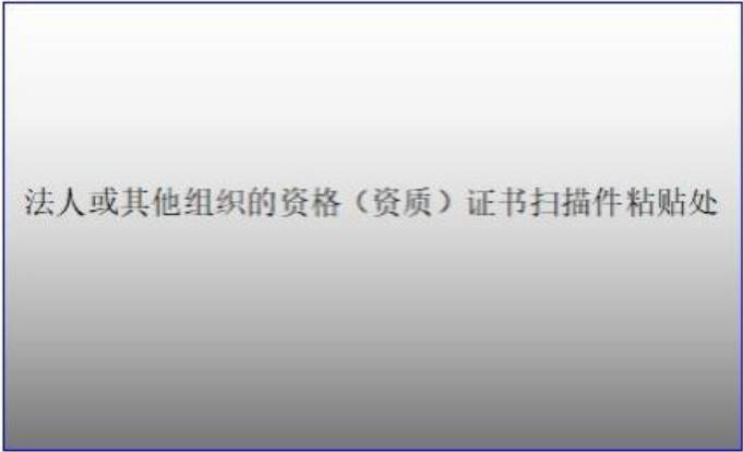
法人或其他组织的资格（资质）证书