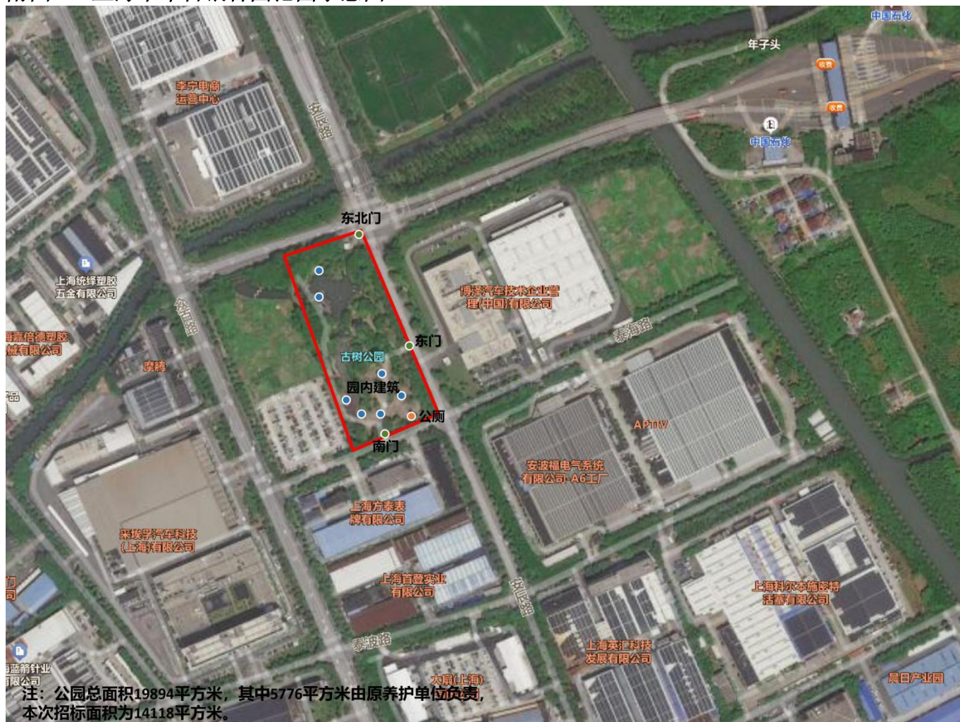
附图 1: 上海千年古银杏园范围示意图