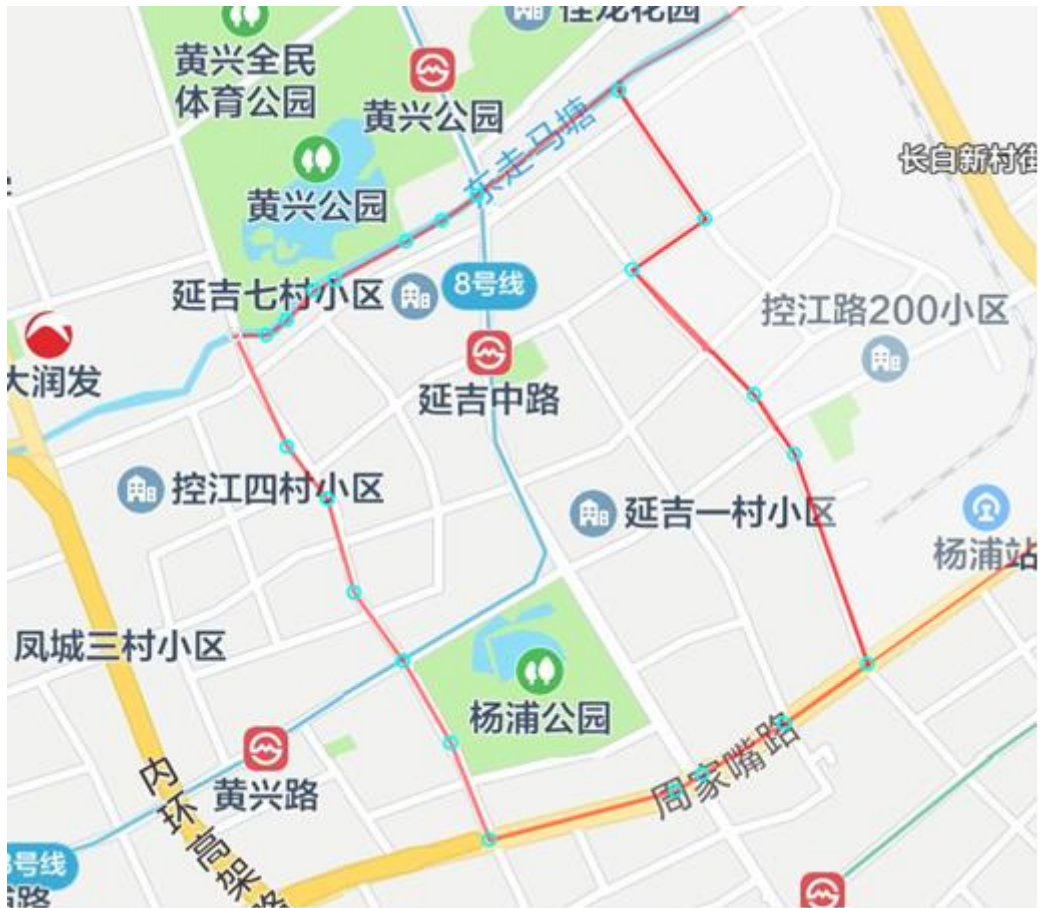
杨浦区管线核查范围示意图