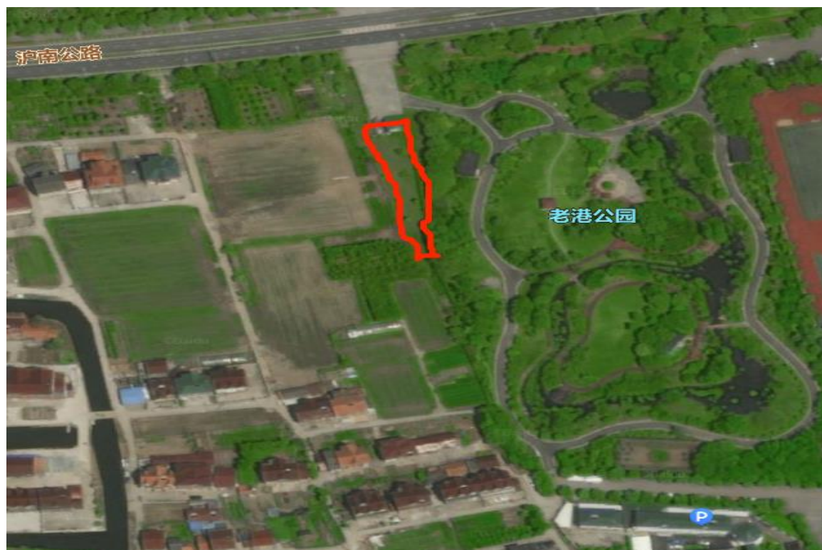
点位 8：沪南公路南老港公园西南角绿化