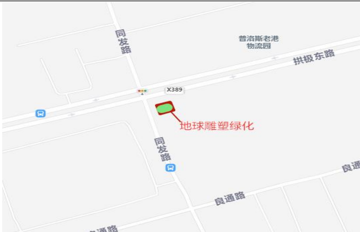
点位 6-2：地球雕塑绿化