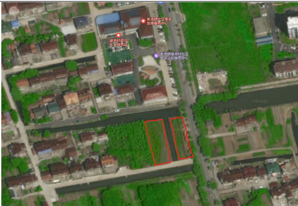
点位 9：建港村（河南侧）绿化