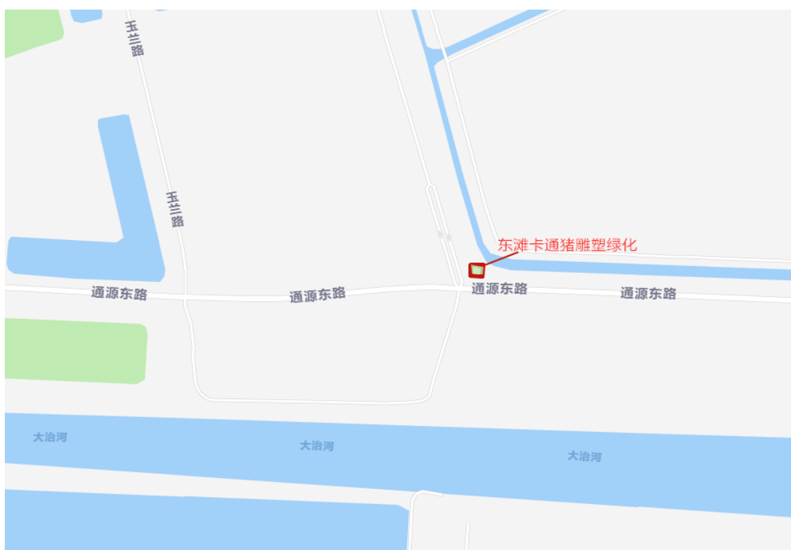
点位 6-3：东滩卡通猪雕塑绿化