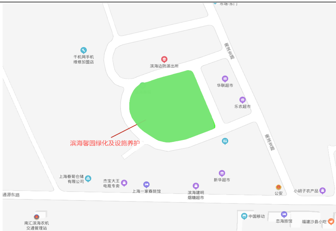
点位 3：滨海馨园绿化及设施养护