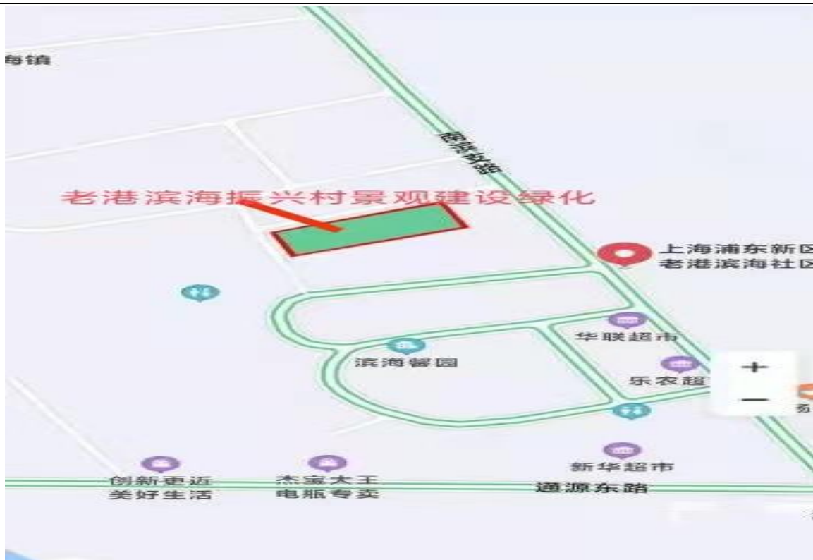
点位 5：老港滨海振兴村景观建设绿化