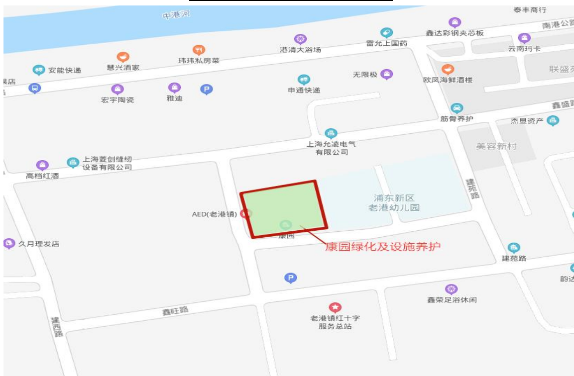
点位 2：康园绿化及设施养护