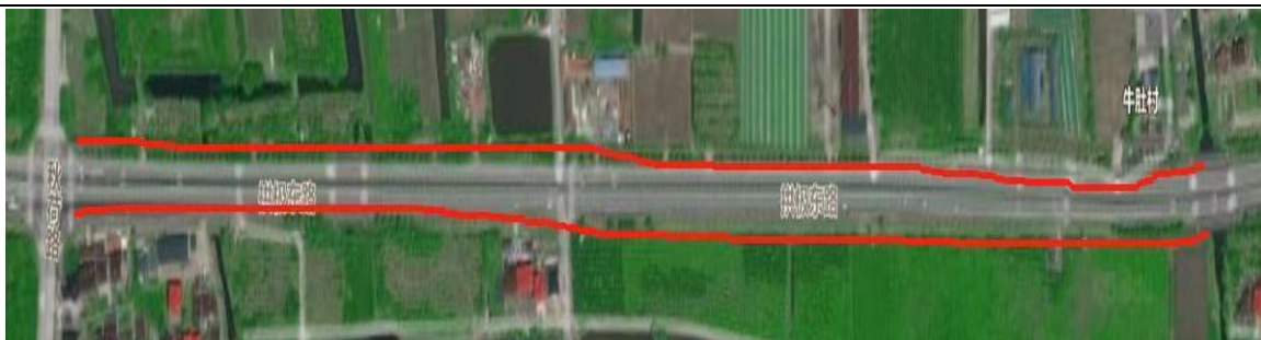
点位 11：老港基地周边包括拱极路两侧绿化