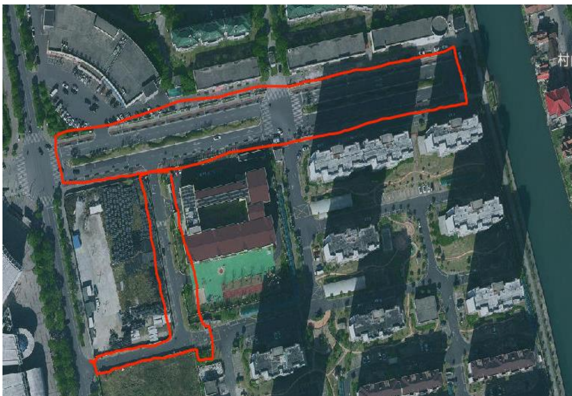
点位 10：港怡路（建中路以东）中间绿化以及港育路两侧绿化