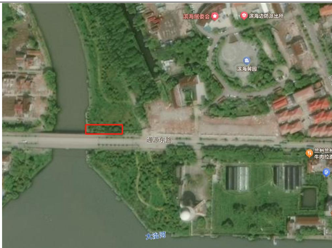
点位 13：通源东路北侧滨海 1 号桥东侧绿化