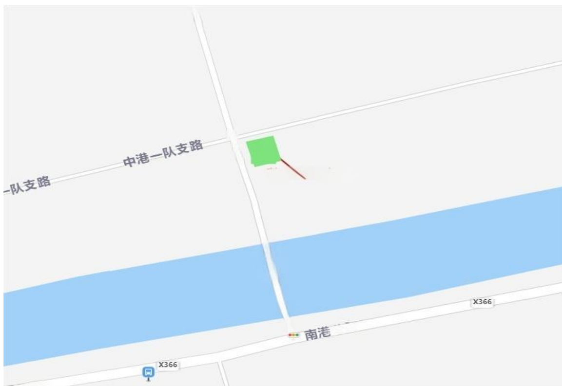
点位 6-1：四好农村路雕塑绿化