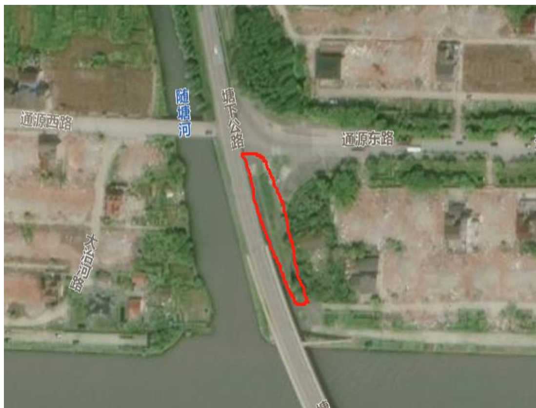
点位 14：通源东路南侧南滨公路交界处绿化