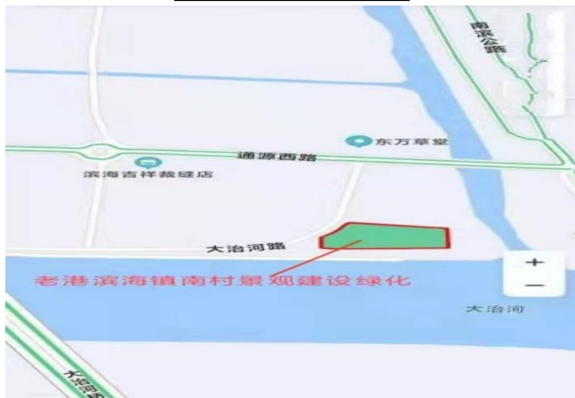
点位 4：老港滨海镇南村景观建设绿化