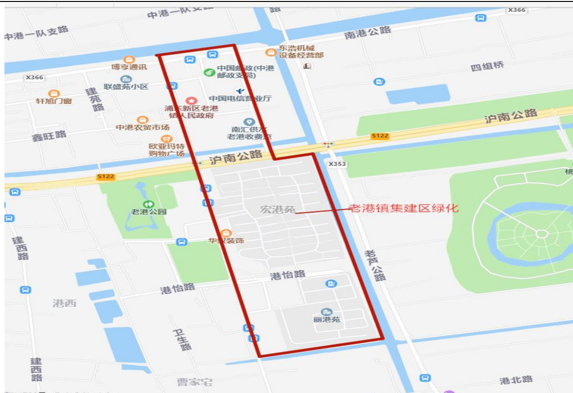
点位 7：老港集建区所有公共绿化